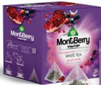
Pomegranate & Forest fruit WHITE TEA الشاي الأبيض مع الرمان و فواكه الغابة