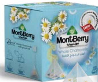
Whole Chamomile أزهار البابونج الكاملة