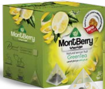
Natural lemon fruit GreenTea شاي أخضر مع قطع الليمون