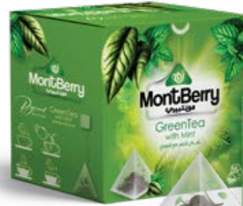
GreenTea with Mint شاي أخضر مع النعناع