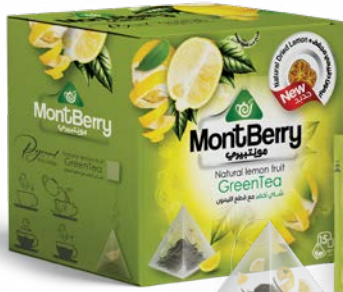
Natural lemon fruit GreenTea شاي أخضر مع قطع الليمون