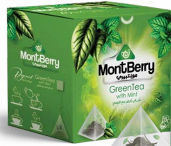
GreenTea with Mint شاي أخضر مع النعناع