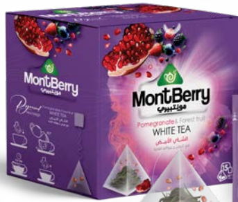
Pomegranate & Forest fruit WHITE TEA الشاي الأبيض مع الرمان و فواكه الغابة