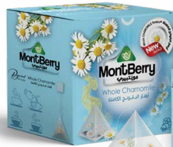
Whole Chamomile أزهار البابونج الكاملة